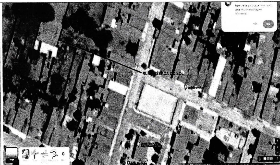
Imagem de satélite

NOME ANTERIOR DA VIA: RUA PROJETADA NOME SUGERIDO: ENSEADA DO SOL ZONA: RURAL BAIRRO: COMUNIDADE DE REDONDA REFERÊNCIA: PRÓXIMO A QUADRA POLIESPORTIVA