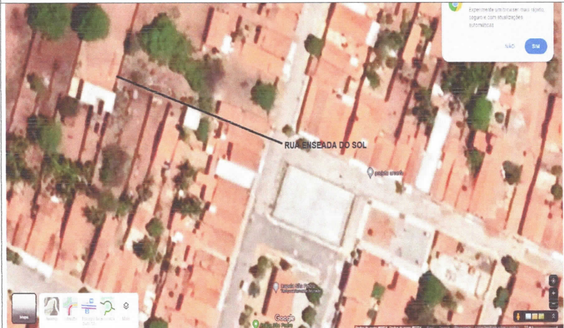
Imagem de satélite

NOME ANTERIOR DA VIA: RUA PROJETADA NOME SUGERIDO: ENSEADA DO SOL ZONA: RURAL BAIRRO: COMUNIDADE DE REDONDA REFERÊNCIA: PRÓXIMO A QUADRA POLIESPORTIVA