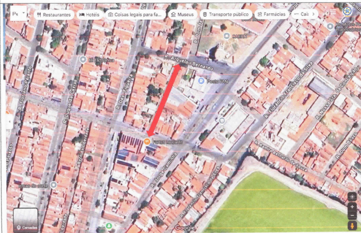
Imagem de satélite

NOME ANTERIOR DA VIA: RUA BOM JESUS NOME SUGERIDO: RUA JOÃO JERÔNIMO REBOUÇAS ZONA: URBANA BAIRRO: CENTRO REFERÊNCIA: POR TRAZ DO POSTO IGUANA